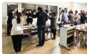
全社員ミーティングの様子

表彰なども執り行われ、日頃の努力や成果を全社員で称え合う有意義な時間となりました。さらに、社員一人ひとりが「今年の約束」を発表しました。今年の約束とは、2026年をどのような心持ちで過ごしていくか、自身の行動指針や目標を