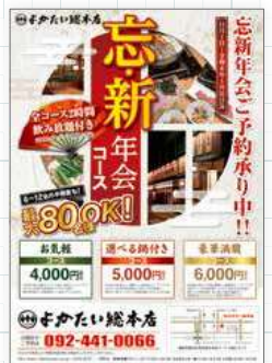
スーパーの朝刊折込チラシに!