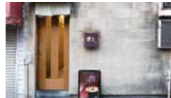
▲「渡なべ」さんの外観