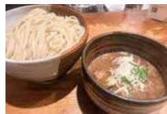
▲「渡なべ」さんで注文したつけ麺

いつもお世話になっております。高田馬場の人気ラーメン屋「渡なべ」さんに行ってきました。時間をずらして訪問しましたが、4人ほど並んでおりました。流石人気店です。つけ麺大盛りを注文しました。甘すぎず、鯉系の魚介の香りが強い濃い目のスープに細めの中太麺がよく絡みます。特にメンマが分厚く大きいのにしっかり味がついていて最高です。チャーシューやネギも美味し具材のこだわりを感じました。定期的に期間限定メニューを提供されている、意欲店です。次はラーメンを食べたいと思います。