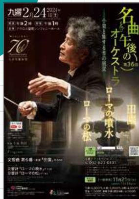
コンサートやイベントの告知に!